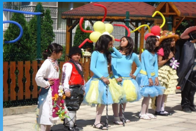
Festival for the ethnical tolerance